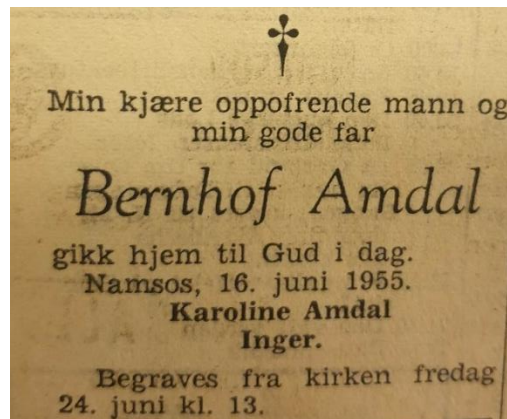
Namdal Arbeiderblad 18. juni 1955