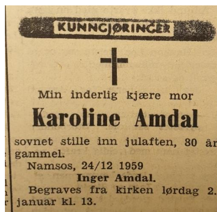
Namdal Arbeiderblad 29. desember 1959

Døden kom ikke som noen overraskelse. En lang og krevende arbeidsdag hadde satt sine spor. De to siste årene av livet var hun helsemessig mye plaget og sengeliggende. Julaften 1959, fire år etter sin ektemann, gikk hun bort.